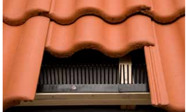
Ovan: Montering av Fågelband

Vintertid skall fågelbanden förvaras i rumstemperatur före montering.