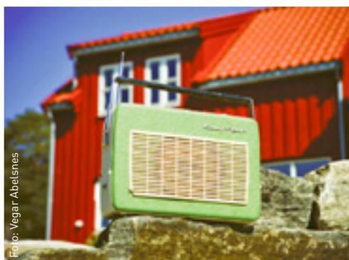
Med Hunton Vindtät kan du göra om sommarstugan till en åretruntbostad.