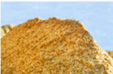
Från vårt råvarulager (flis) i Gjøvik.

Hunton Vindtät tillverkas genom en miljövänlig process där flis från sågverk mals ned till en fin massa. Massan tillförs sedan stora mängder vatten innan den pressas samman till en porös träfiber skiva. Fibrerna binds samman med lignin – träets eget naturliga lim. Skivan är en ren träprodukt, impregnerad med asfalt för att öka fuktmotståndet. Impregneringen gör Hunton Vindtät åldersbeständig och motståndskraftig mot mögel, röta och skadedjursangrepp.