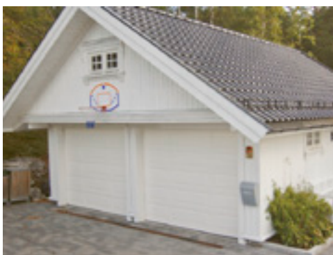
Om du vill ha ett ombyggt garage kan det vara en bra idé att använda Hunton Vindtät.