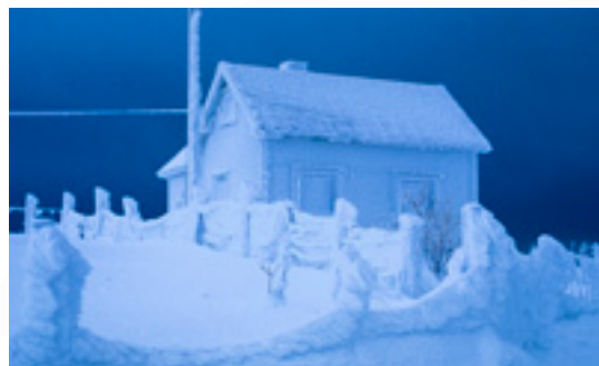
Med Hunton Vindtät får du en behaglig inomhusmiljö, även när det är blött och kallt ute.