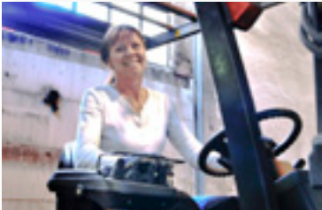
Här tillverkas träfiberskivorna.

Hunton Vindtät tillverkas vid vår fabrik i Gjøvik, Norge. Det hårda norska klimatet gör att skivorna måste vara extra motståndskraftiga mot väder och vind. Att Hunton Vindtät står emot kallt, fuktigt, men också varmt väder har gjort den populär över hela världen. Nästan 50% av alla asfaltskivor som vi tillverkar exporteras.