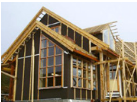
Nyproducerat hus med Hunton Vindtät som vindskydd där Hunton tejp och primer ökar tätheten på klimatskyddet.

Hunton Fibers Tejp & Primer produceras av SIGA, den ledande producenten i Europa på utveckling och produktion av produkter utan skadliga material i tejplosningarna. Tejpen är diffusionsöppen, flexibel, UV-stabil, regntålig och hållersbeständig upp till 50 år.