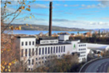
Huntons fabrik i Gjøvik.