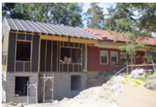
Tillbyggnaden av sons naturdaghjem börjar ta form. Hunton Vindtät ser till att byggnaden är tät.