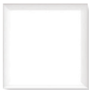
1508-0023 White Glossy 20M