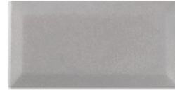
1508-0031 Gris Perla Matt 18M