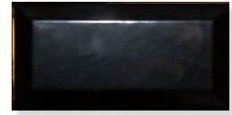
1508-0020 Black Glossy 22M