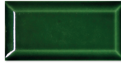
1508-0029 Verde Cristal Glossy 20M