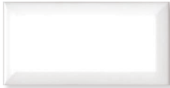
1508-0028 White Mat 14M