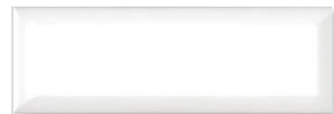
1508-0024 White Glossy 18M

OBS! Verde Cristal kan krackelera vilket är en del av produkttegenskaperna! Sura rengöringsmedel får ej användas på den plattan.